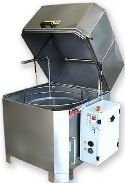
Do rotačních nebo translačních košů