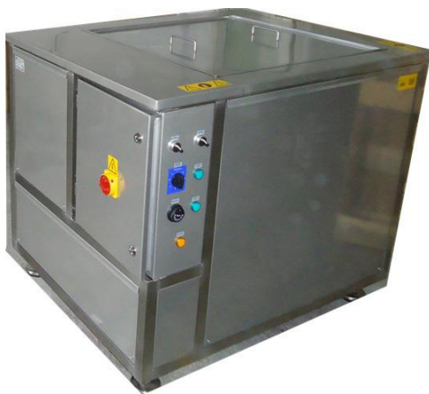
Do ultrazvukových nádrží