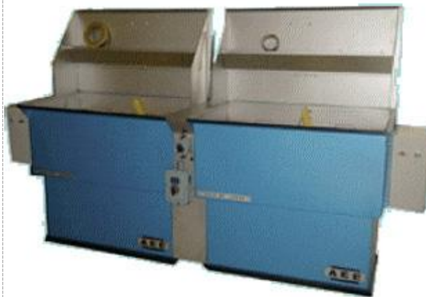
Do ponorných nádrží za tepla i za studena